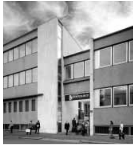
Chiesa di Scientology di Milano.