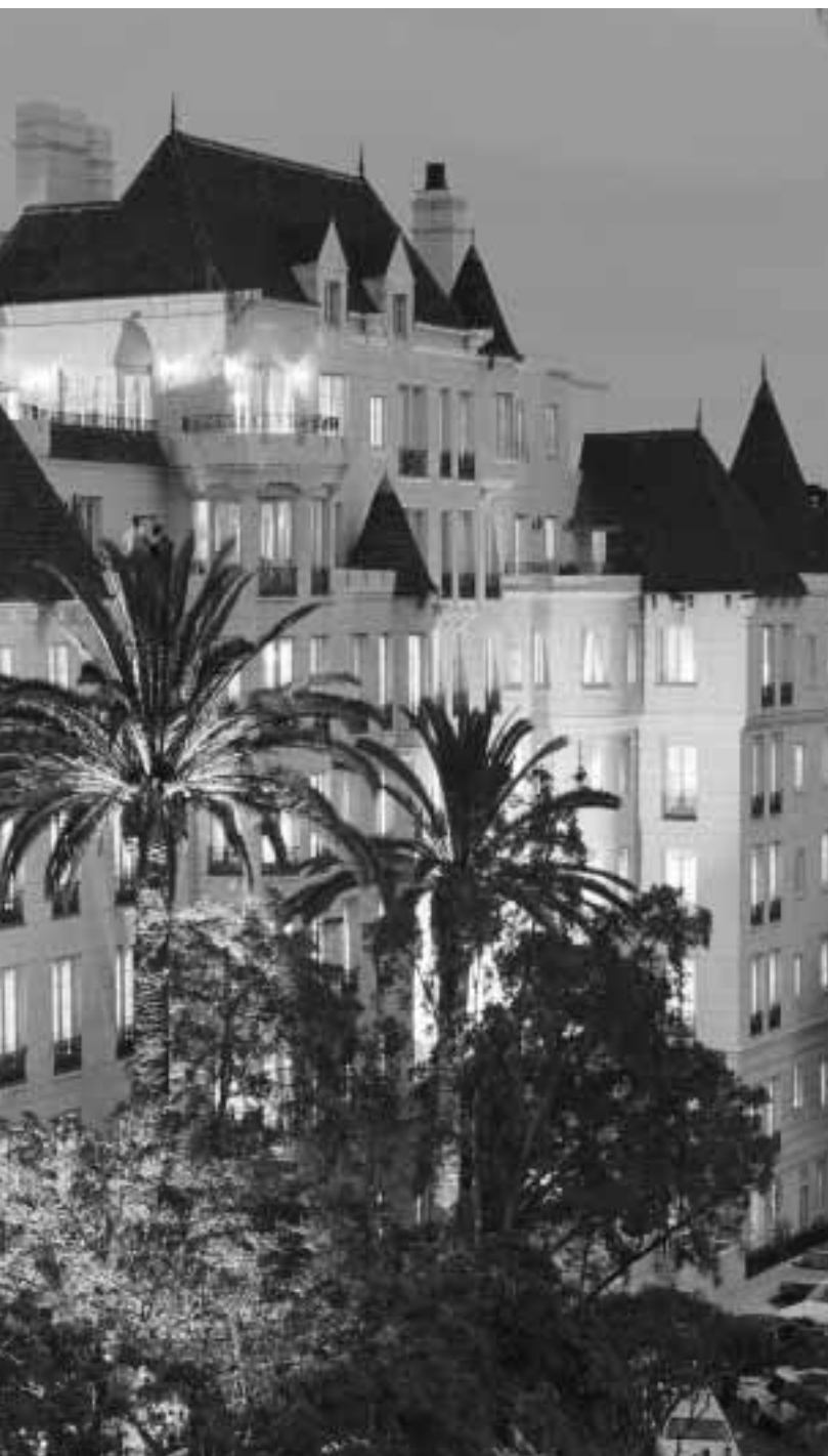
Situata nel cuore di Hollywood, la Chiesa di Scientology Internazionale Celebrity Centre (Centro di Celebrità) è un'oasi per artisti alla ricerca della libertà spirituale attraverso l'applicazione delle tecnologie di Dianetics e di Scientology.