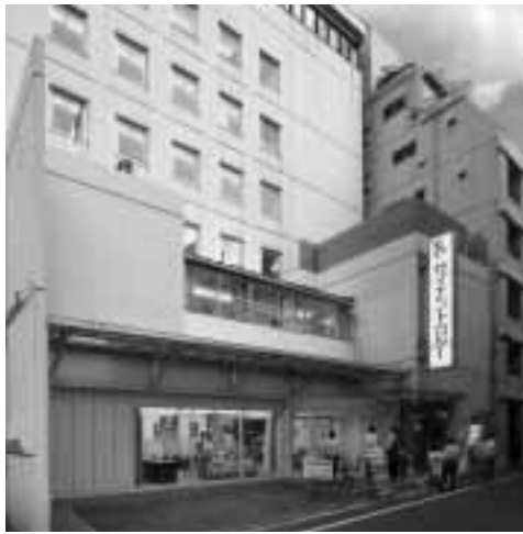
Chiesa di Scientology di Tokyo.