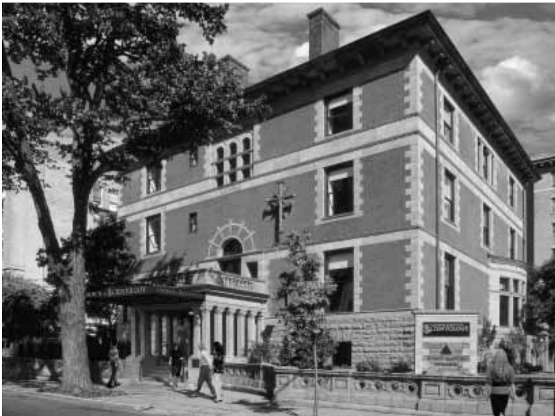
La Chiesa Fondatrice di Scientology a Washington, D.C., costituisce un centro spirituale per esponenti di spicco del mondo degli affari e governativo della capitale.